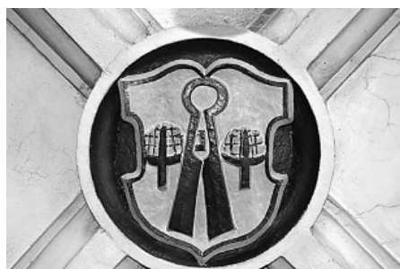
Znak postřihovačů sukna